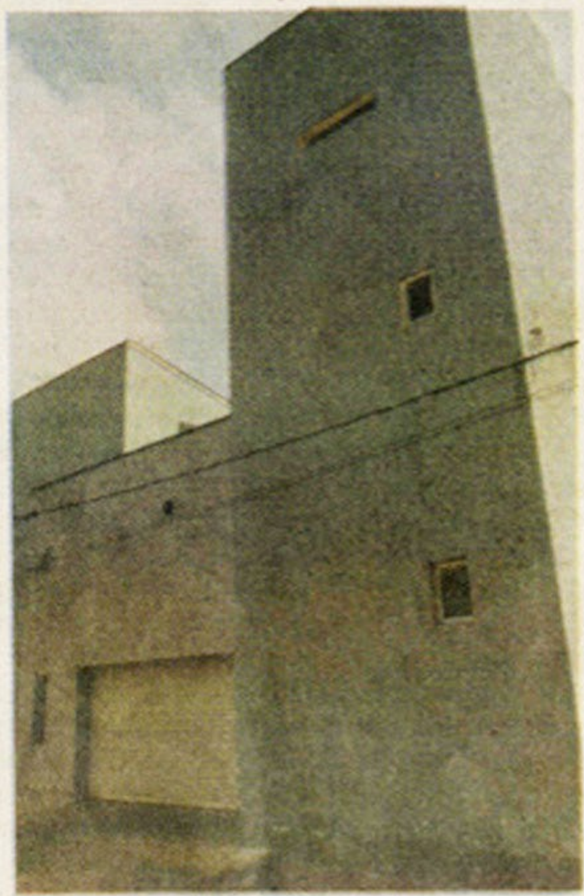
නිවසේ ඉදිරි පෙනුම