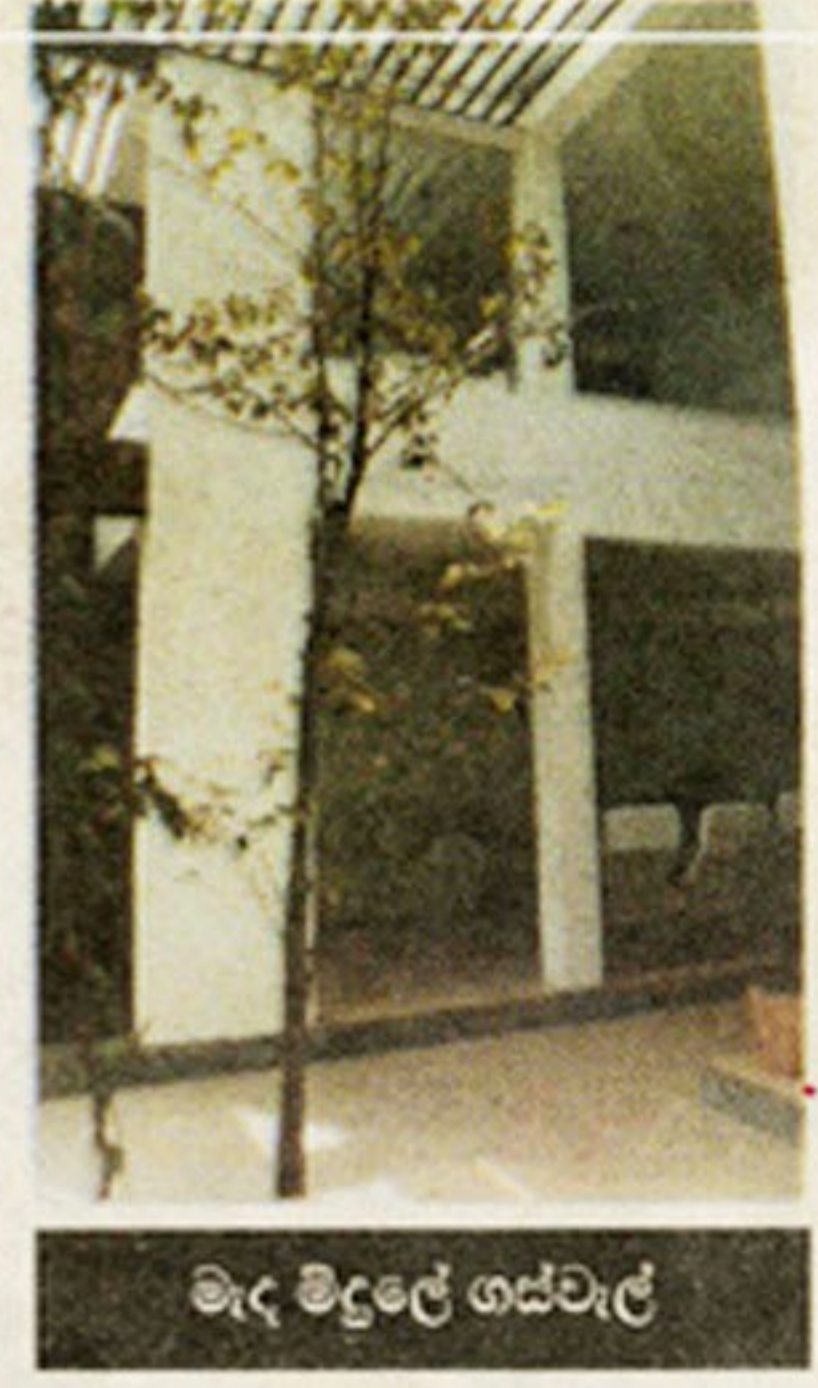
මැද මිදුලේ ගස්වැල්