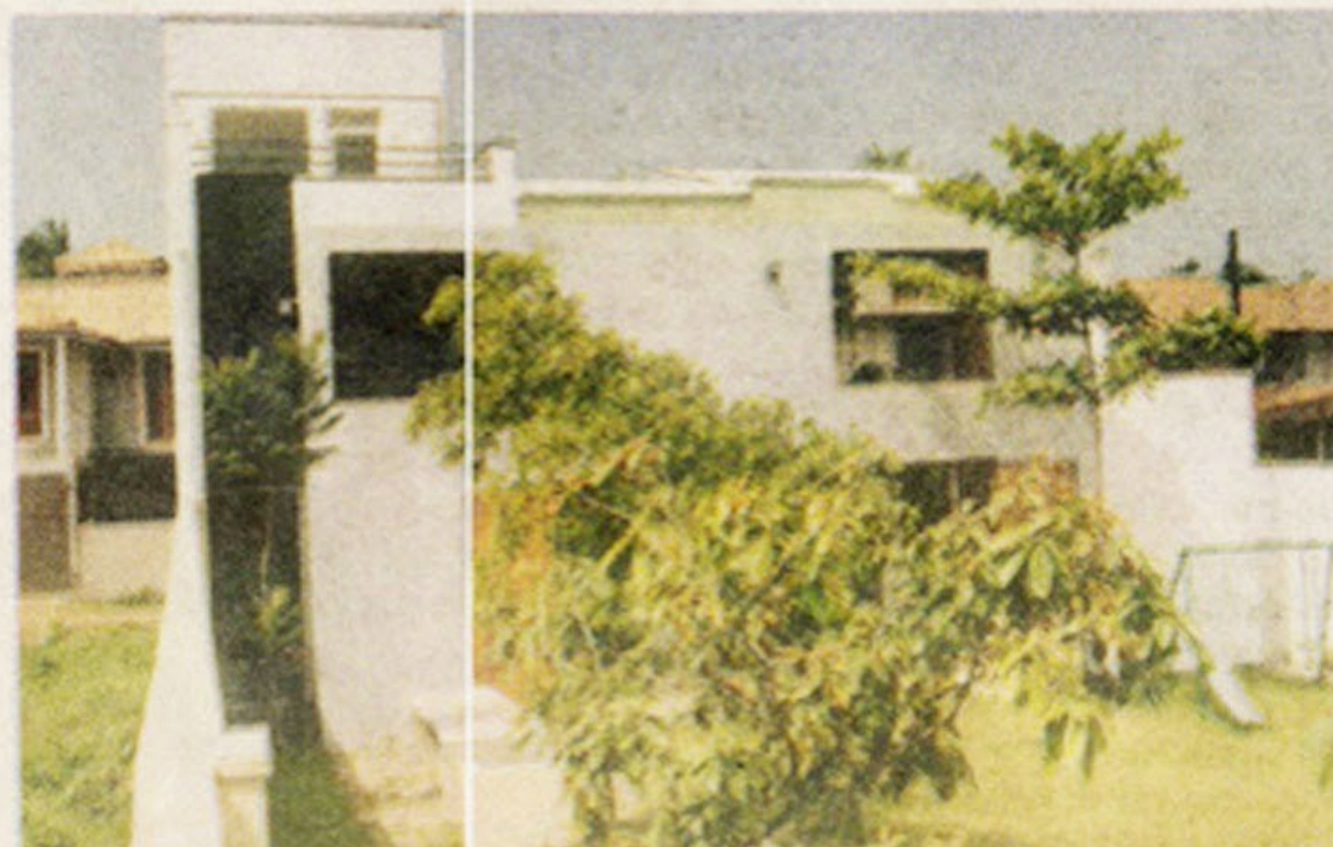
පිටුපස උදාහරණයේ සිට බලන විට නිවස පෙනෙන අයුරු.

ප්‍රවීණ වාස්තු විද්‍යාඥ සුජීන් මොහොමඩ්ගේ නිවසට ගොඩ වැදෙමු