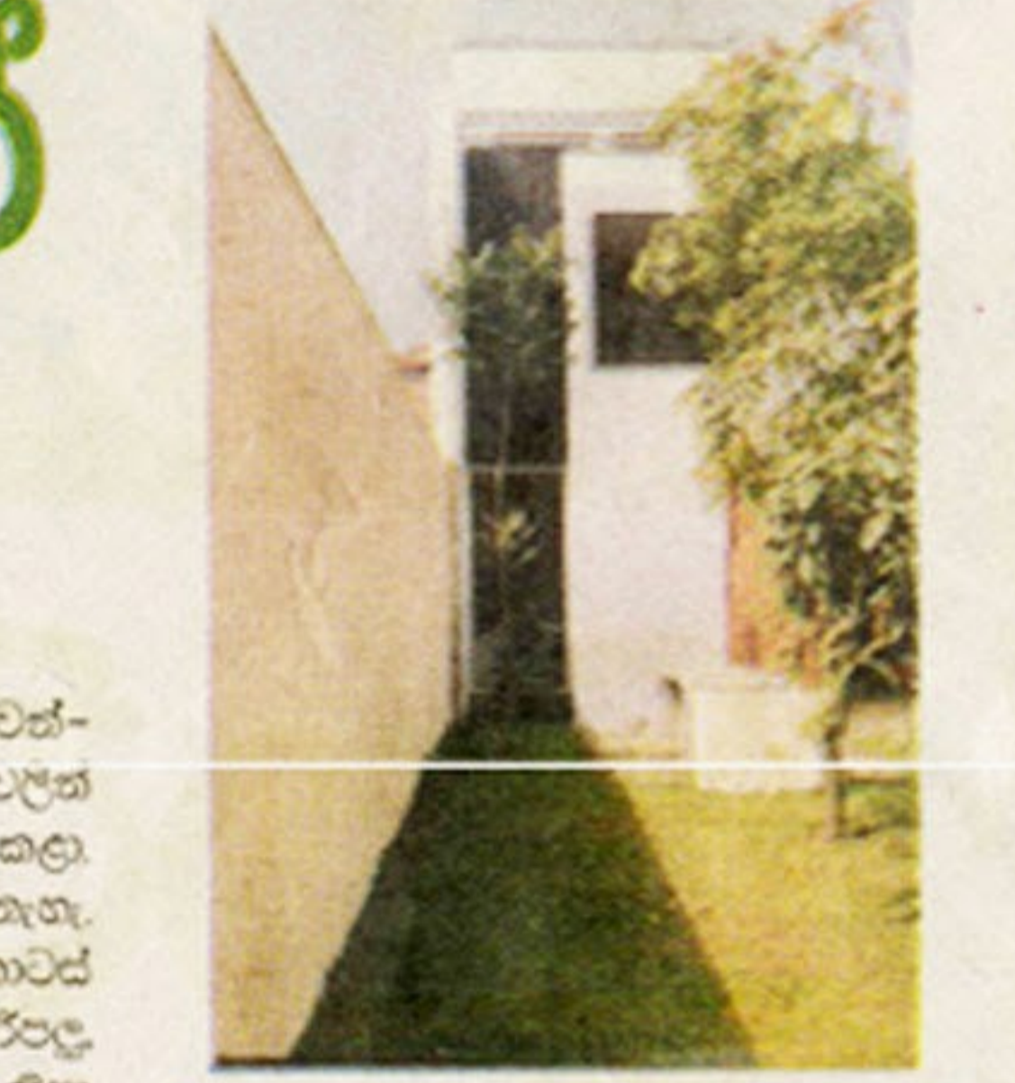
උදාහරණයේ පැත්තකට නිවසේ කොටසක් පෙනෙන අයුරු.

“නිවසේ ඉදිරිපස කොටස සඳහා භාවිතා කළේ අර්ථයට වර්ෂයකට, අර් කියන්නේ අවර්ෂ පාටක් නිසා එය භාවිතා කලා. මොකද පිටතින් එක දුටු විට නිසා වෙනත් වර්ෂයක් භාවිතා කළ විට නිවස ඉක්මනින් ම දුර්වර්ණ වෙන්න පුළුවන්. එතකොට වර්ෂ වර්ෂයක ගන්න වෙනවා. මේ නිසා අර් පාට වගේ ඒක වර්ෂ-