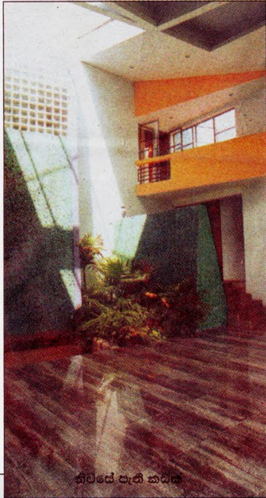
නිවසේ පැති කඩය

“මෙම නිවස නිර්මාණය කරන ලද ඉඩම වඩා ඉඩකඩ සහිත එකකි. ඉඩමට යාබදව වෙල් යායකුත් තිබුණා. මේ නිසා අවට පරිසරයේ නිබෙන සොබා