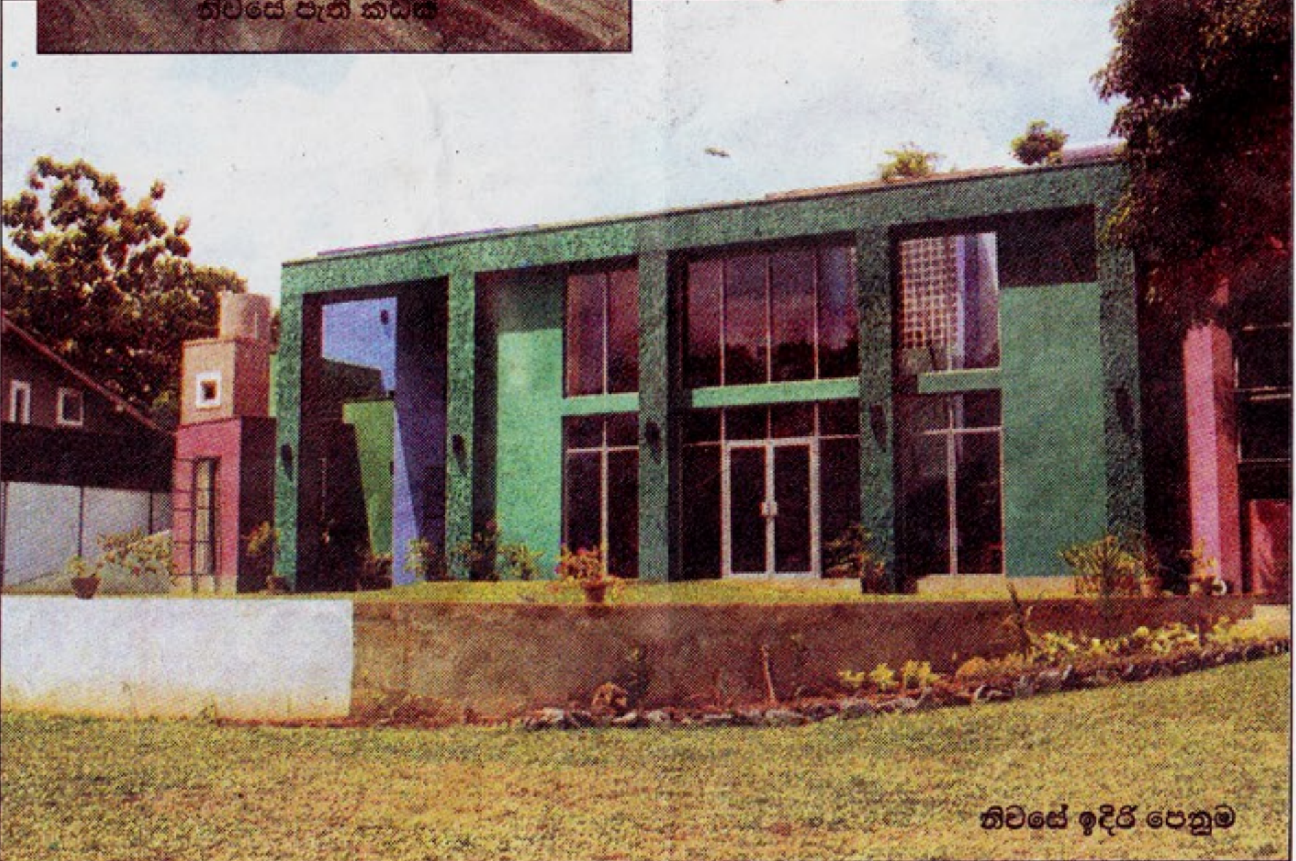
නිවසේ ඉදිරි පෙනුම

නිවසක් ඉදිකර ගැනීමට විශාල මුදල් ප්‍රමාණයක් වැය කරන්නට සිදු වුණත් එය මනාව සකස් කර ගත්තේ තැන්තම් ජීවිතේ හැමදමත් පසු තැවෙන්න සිදු වේවි. ඒ වගේ ම නිවහනකට අත්‍යවශ්‍ය ආකාරයෙන් අලංකරණ යොදා ගැනීම නිසා අමතර වියදමක් දරන්න වෙනවා. මේ නිසා ඉතා ම සරල ව තමන් ගේ පවුලේ සාමාජික පිරිසට ප්‍රමාණවත් සුන්දර නිවහනක් ඉදි කර ගැනීම හැම දෙනා ගේ ම අත්‍යවශ්‍යයට යහපතක් වගේ ම ආශීර්වාදයක් ද වනු ඇත.